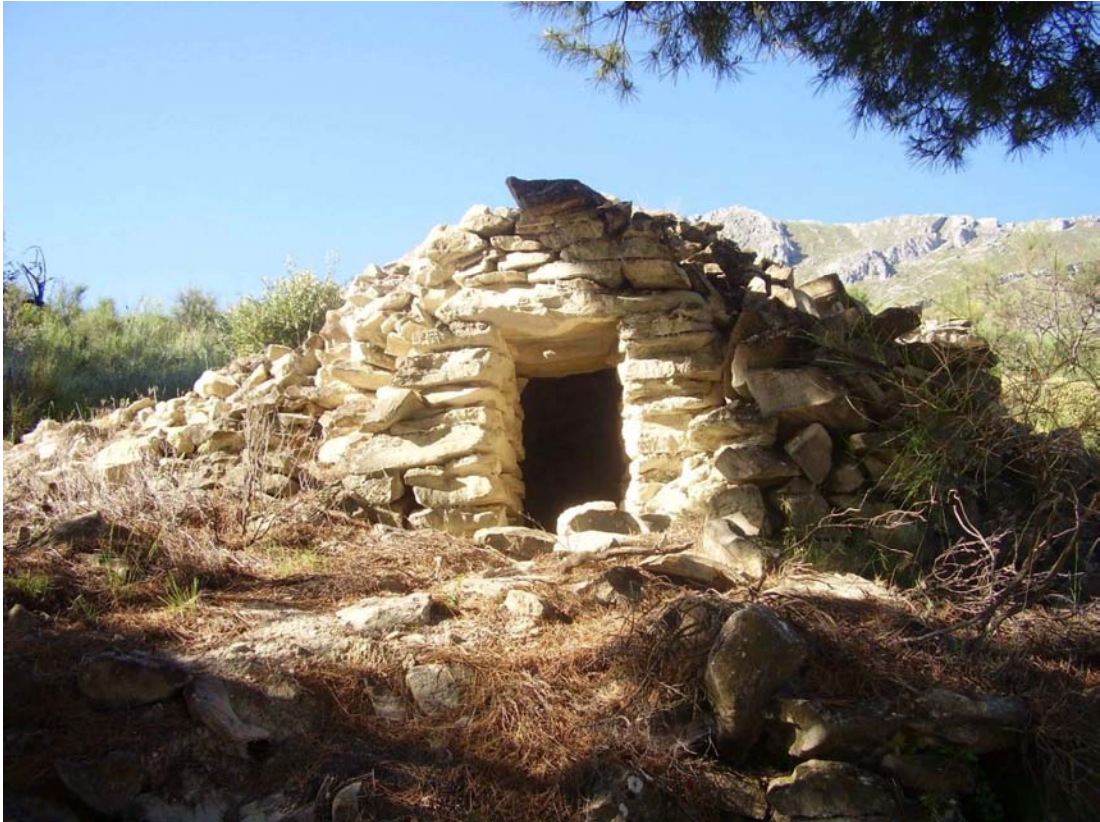
Vista del caracol de Manuel Cayetano