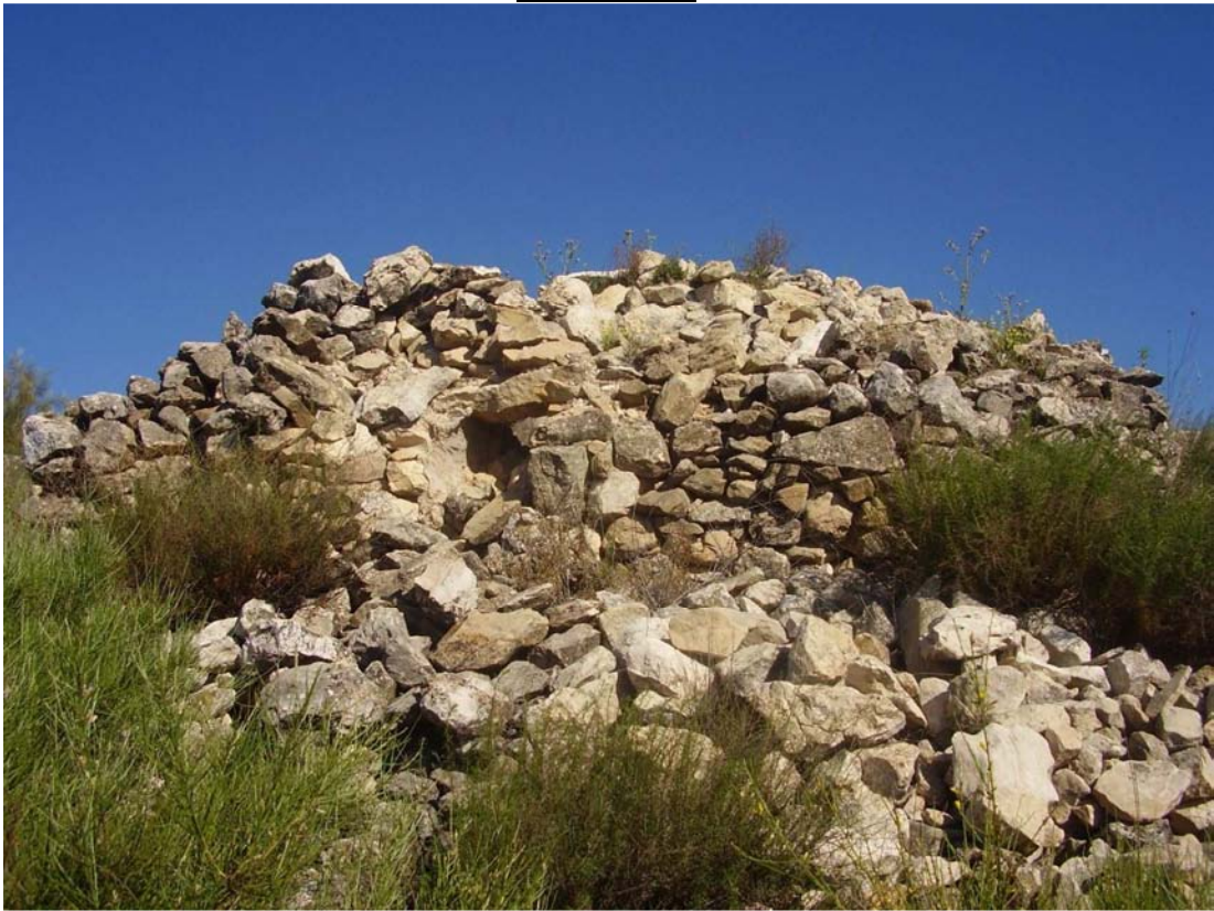
Vistas de los restos del caracol de Corral Blanco