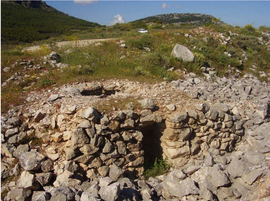
Entrada del caracol n°1 de las Canteras del Llano de Corral Blanco