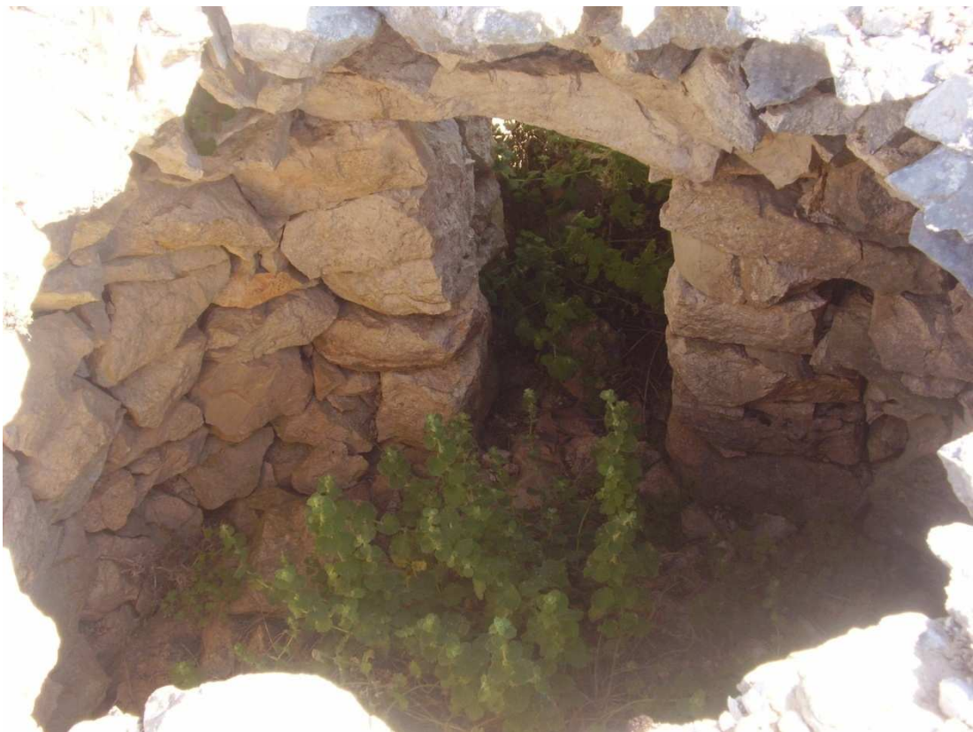
Vista de la entrada desde el interior