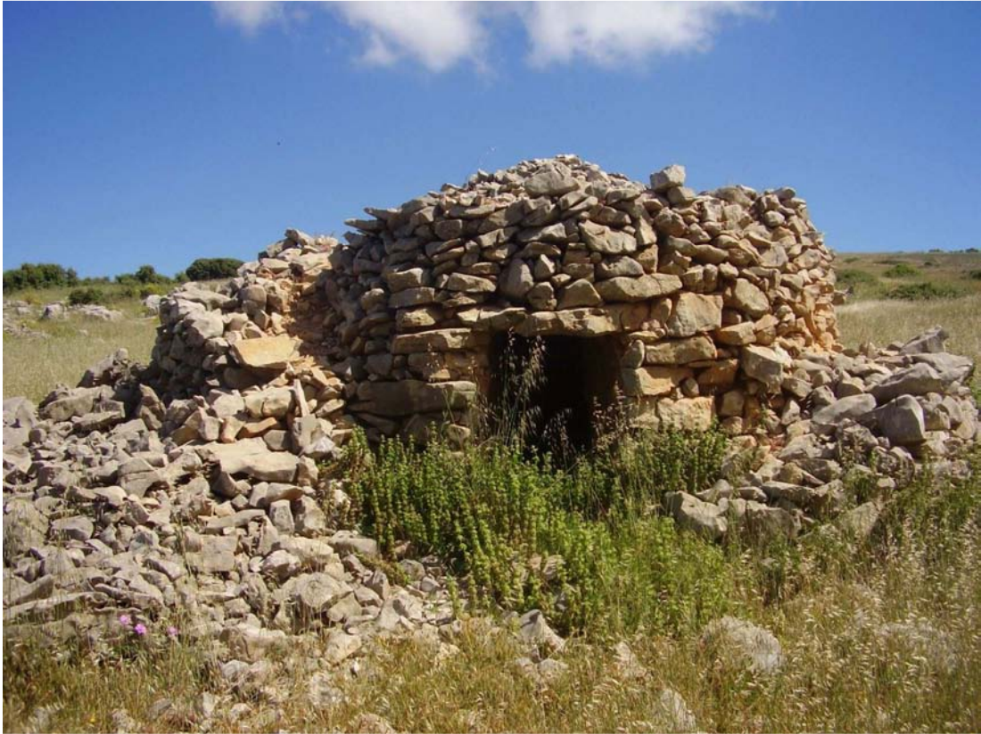
Vista general del Caracol de Poyatos