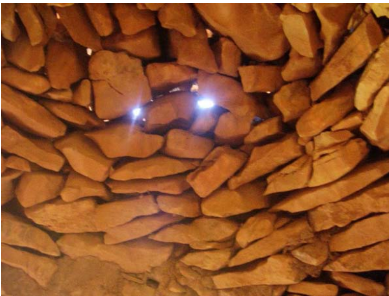
Vistas de la entrada y la estructura de la cubierta del caracol.