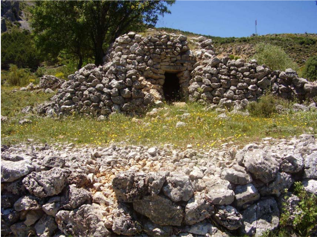
Vista general del Chozo de Hoyo Majano