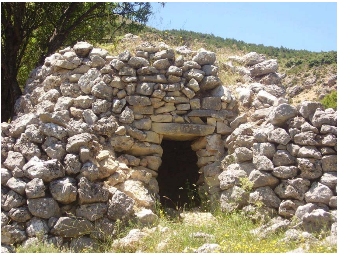
Vista frontal del Chozo de Hoyo Majano