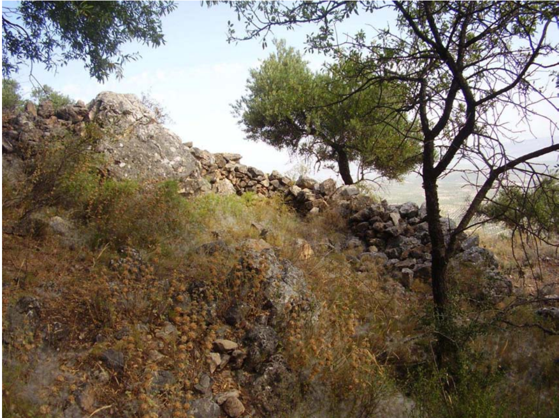
Restos de la tapia del corral