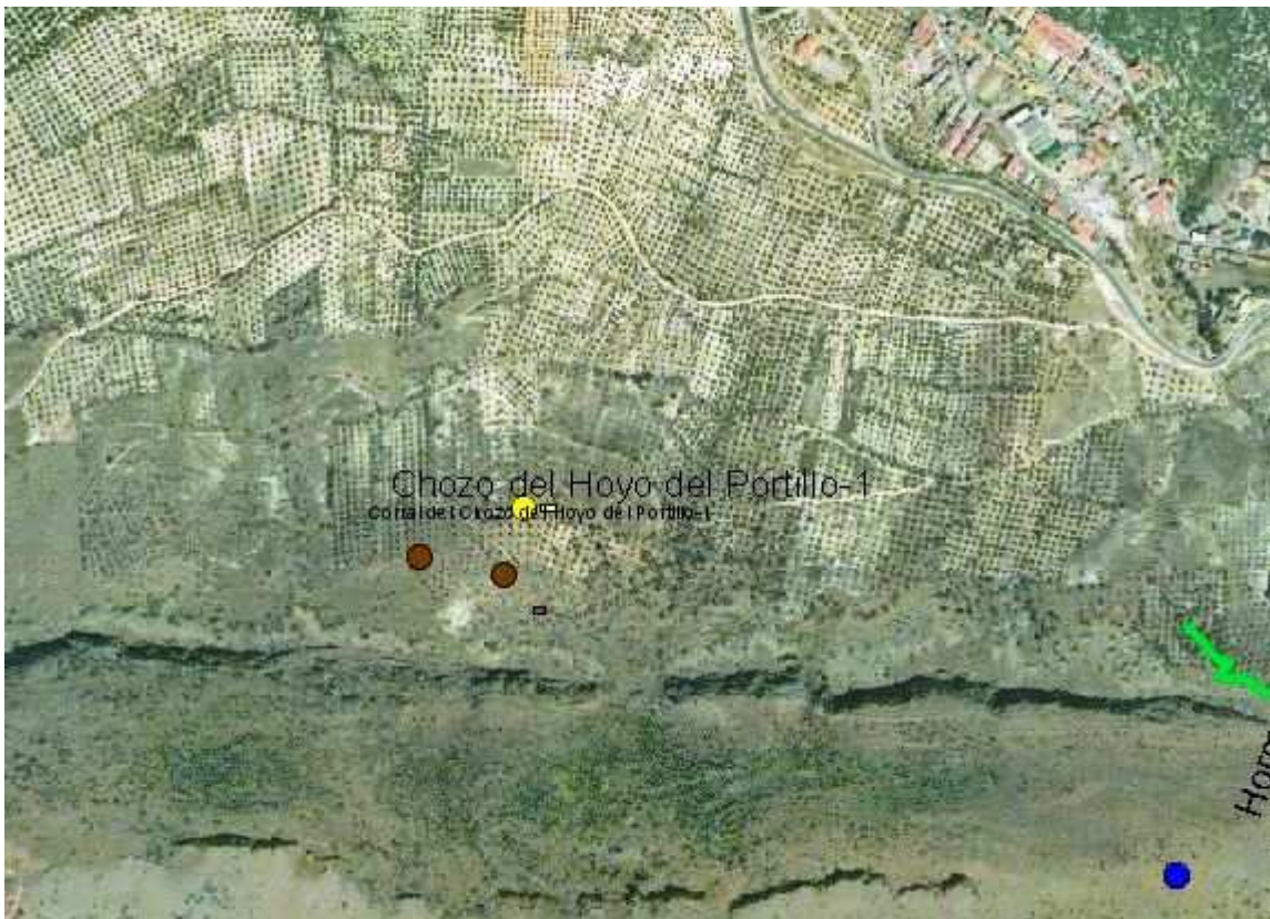
Datos mapa: Ortofoto digital de Andalucía 2002