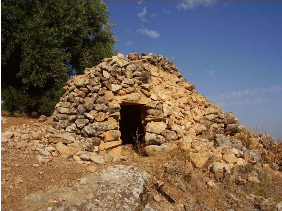
Vista del Chozo del Hoyo del Portillo-1