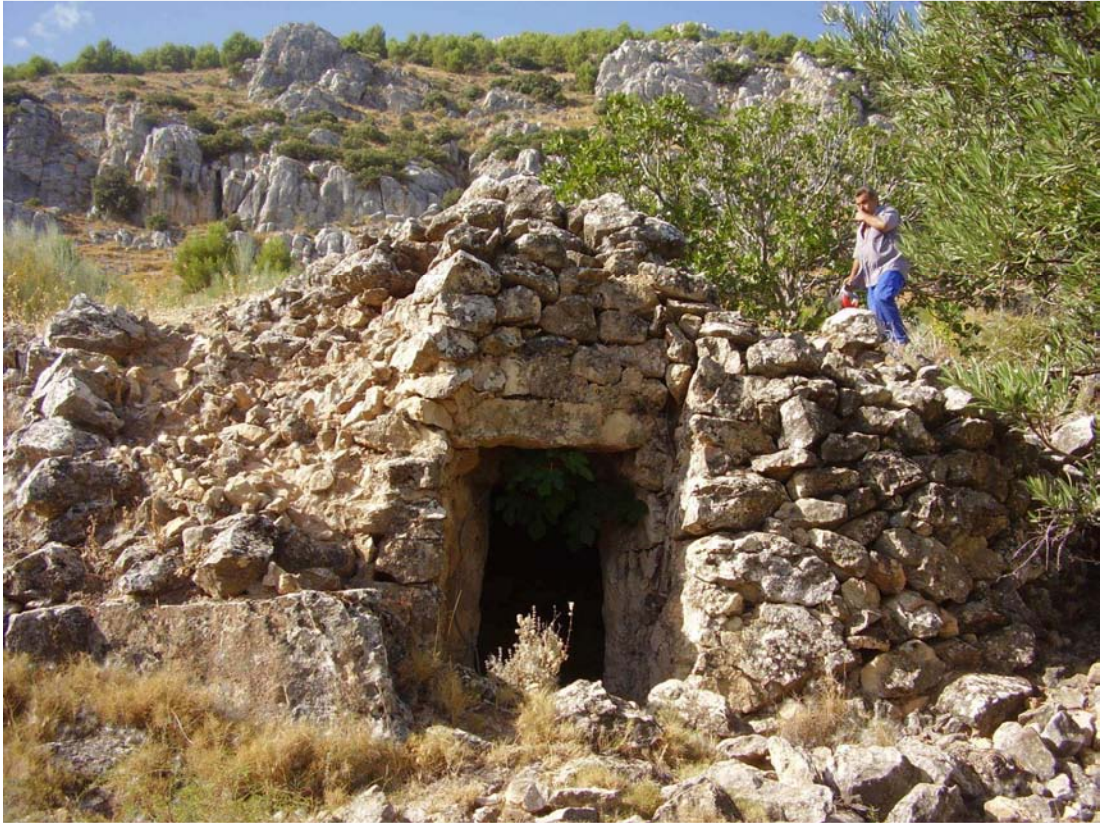
Vistas del Chozo de la Higuera Parranchán