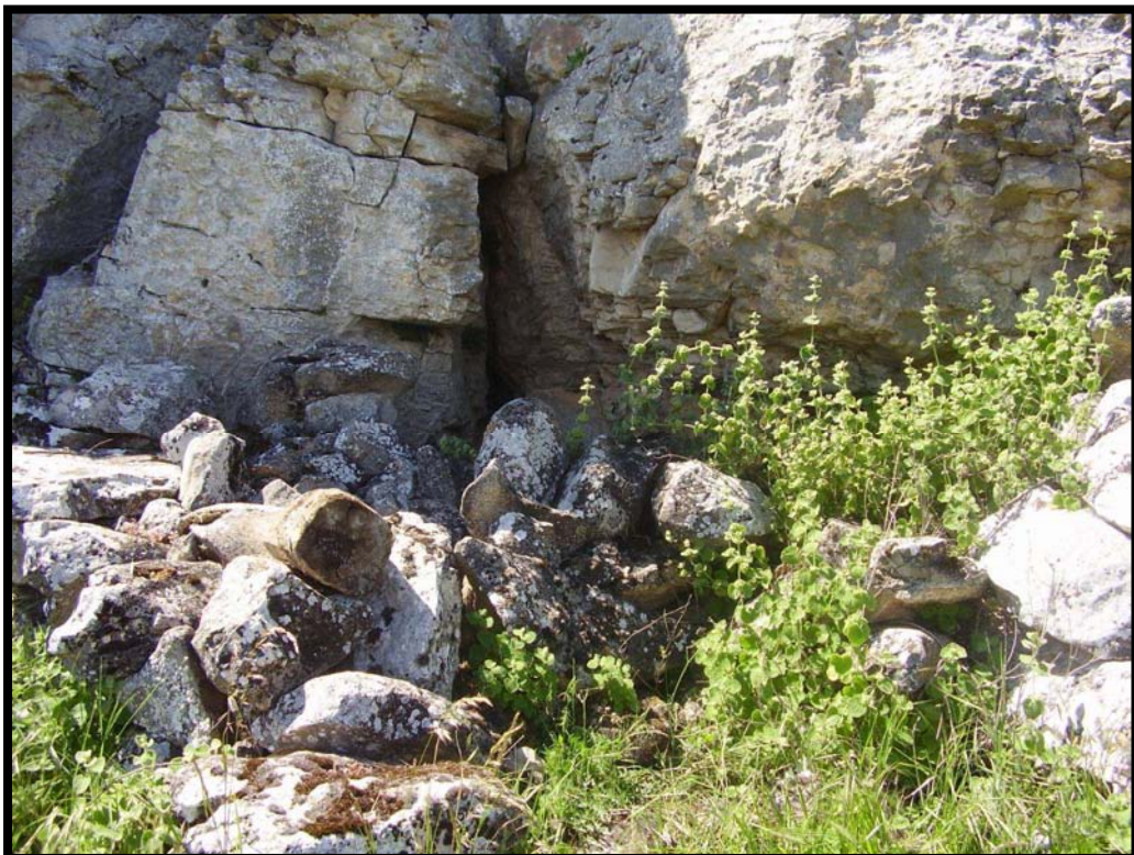
Covacha del Corral de las Entradillas