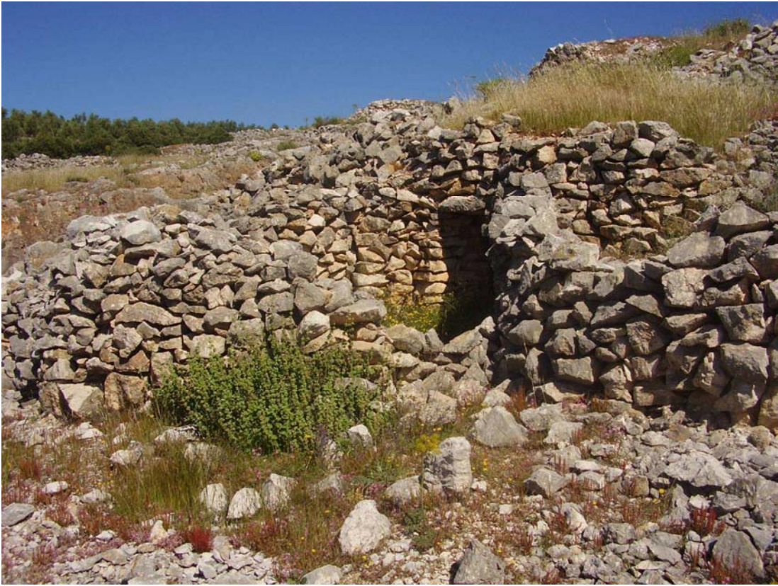
Corral del caracol nº1 de la Cañada de las Canteras