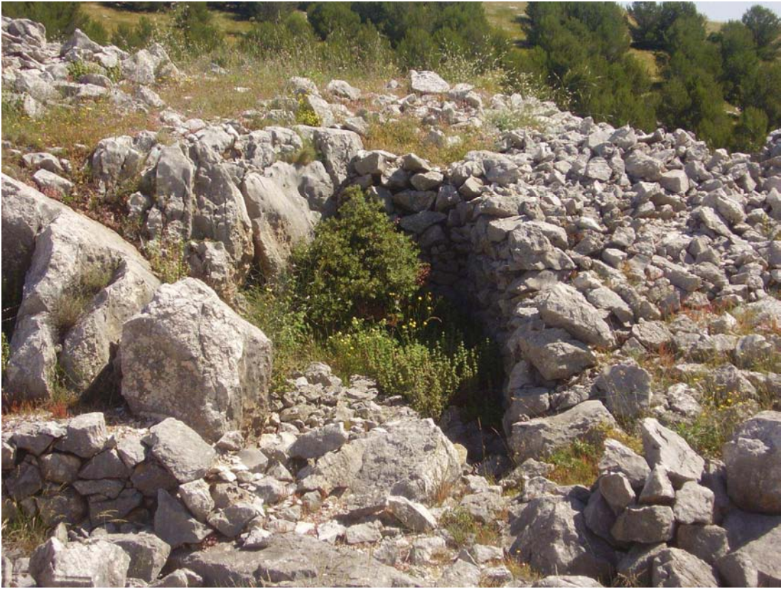
Corral de la Cañada de las Canteras nº2