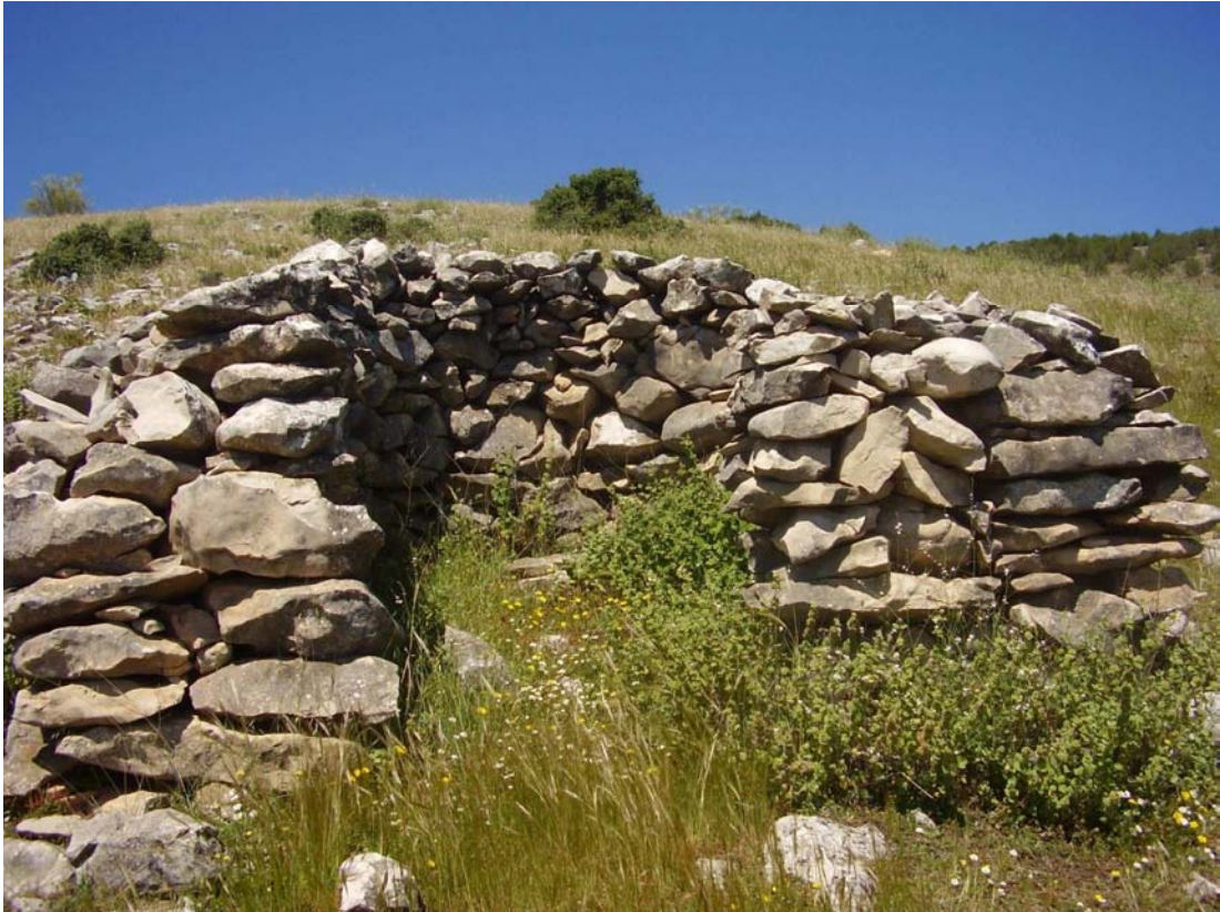
Vista del rancho ubicado en el paraje Cañada de las Matas