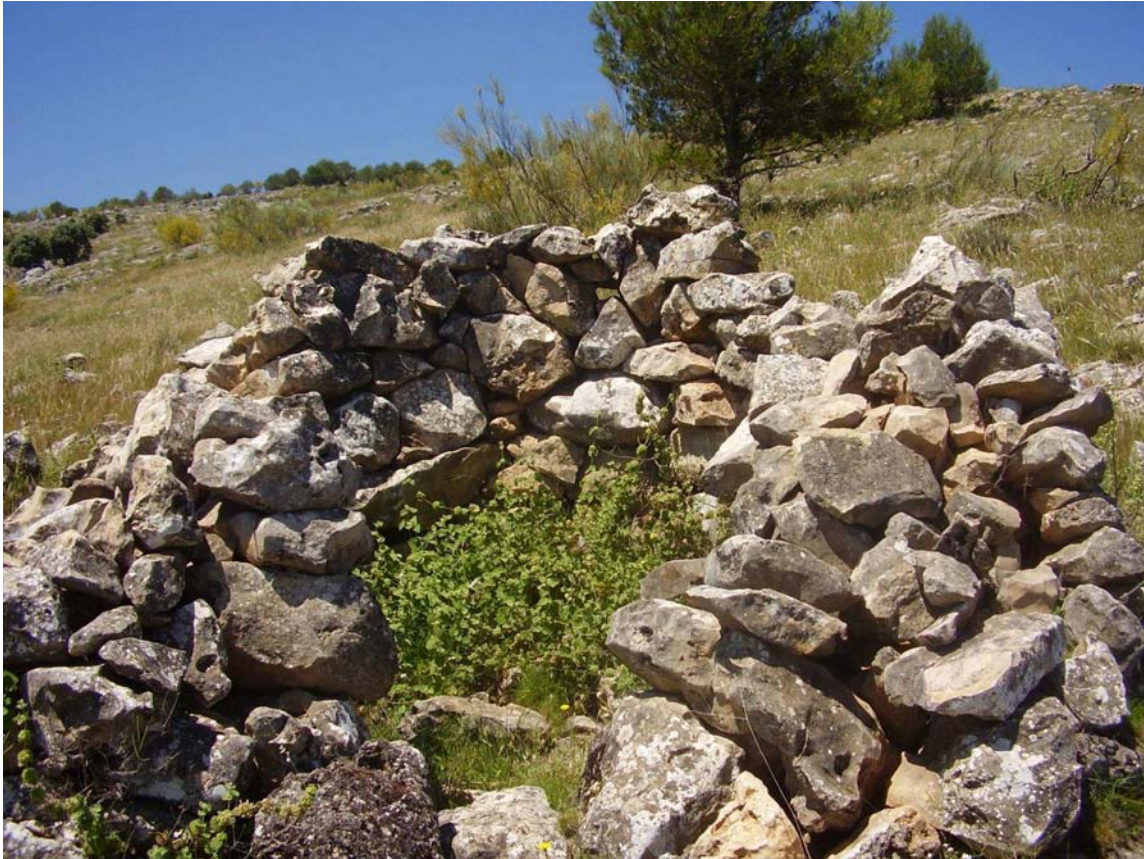
Vista del rancho ubicado en el paraje El Canto