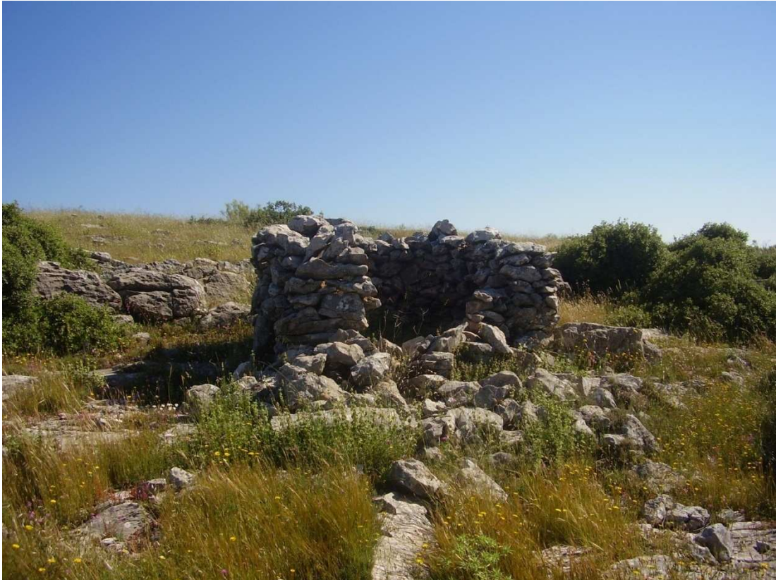
Vista del rancho ubicado en el paraje de Piedra Quebrada