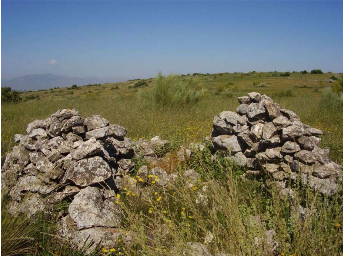
Vista del rancho ubicado en el paraje de la Lomilla de los Espinos