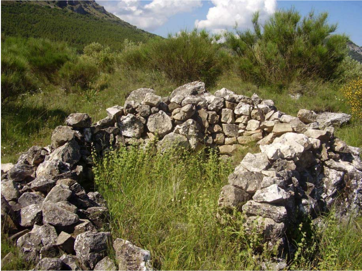
Vista del rancho ubicado en el paraje del cerrillo de Marilópez