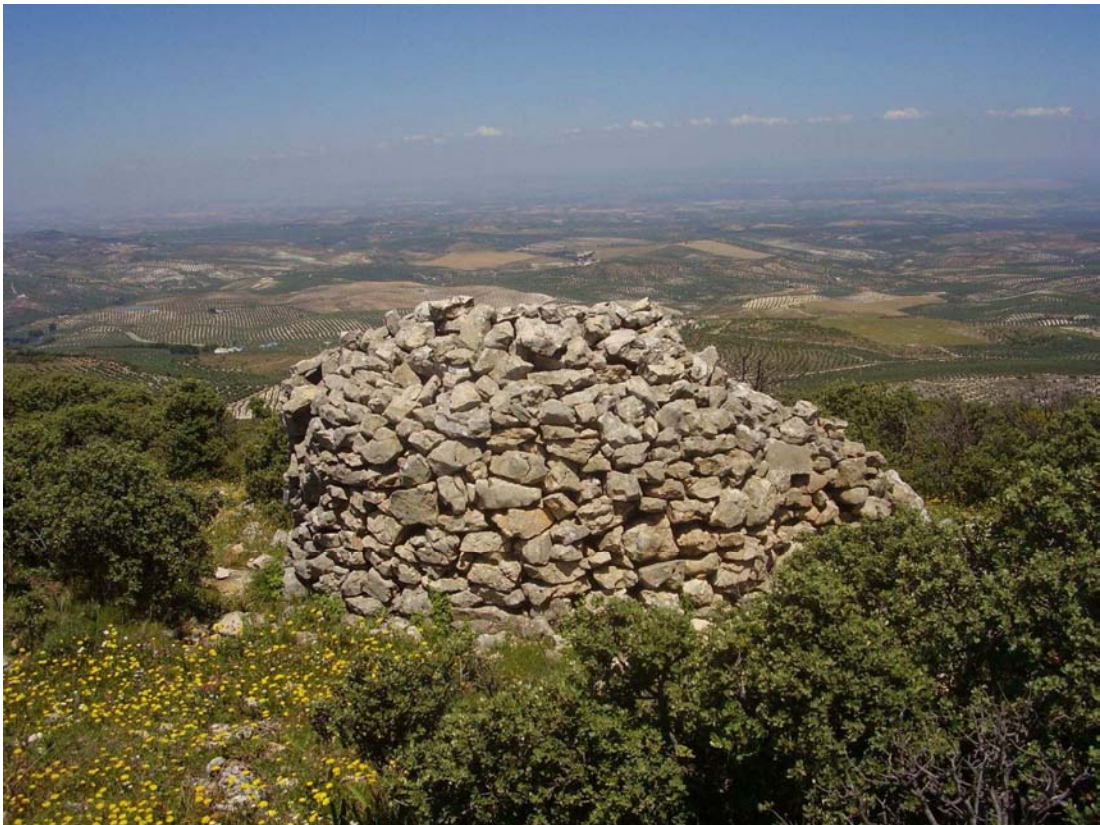
Vista por detrás del rancho de la Portera