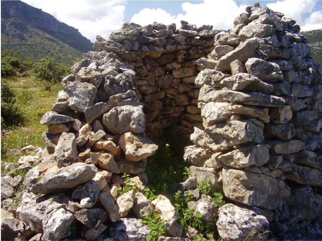
Vista frontal del rancho de la Portera