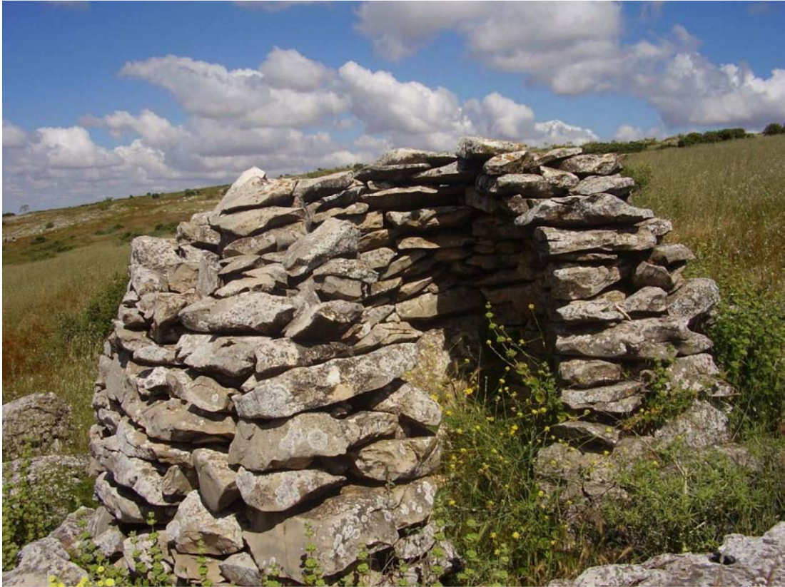
Vista frontal del rancho de los Picones