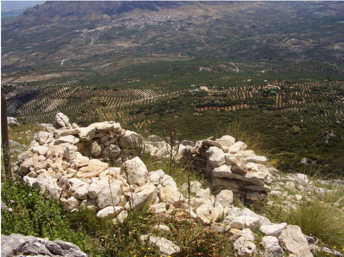
Vista general del rancho de las Lagunillas