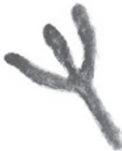
Figura nº 7

Breve análisis de la diferente simbología de otros yacimientos: