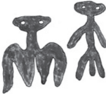
Figura N° 11.

Se trata de dos figuras procedentes de la Cueva del Bacinete en Los Barrios (Cádiz). Aquí podemos apreciar otra forma de evolución al antropomorfo. (Figuras catalogadas dentro del arte sureño y que aparecen representadas en medio de una escena de caza).