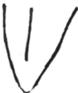
Figura N° 8.

Hemos querido comenzar con un signo muy próximo a La graja; (pertenece al yacimiento de Navalcán), este símbolo pubiano puro y en posición correcta, representa lo que pudiéramos llamar, una doble interpretación. Se trata de un pubis que alarga la línea central y de esta forma surge quizá el primer antropomorfo, su representación nos invita a imaginar un ser humano elevando sus brazos al cielo.