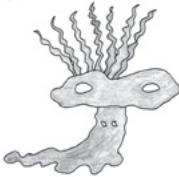
Figura N° 3.

Se trata de un detalle de la figura anterior; podemos apreciar con mayor nitidez como los cabellos aparentes, son claras figuras serpentiformes y la cabeza extraña son los dos senos femeninos, denunciando el sentido que se tenía de un acto tan importante para la procreación, como es el de la fecundación.