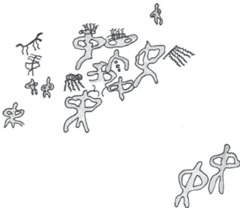
Tabla ideográfica de La Graja.

Pero si hacemos un breve repaso al panel ideográfico; vemos que está compuesto de símbolos de diferentes caracteres entre los que destacan los pubianos, serpentiformes y algún que otro zoomorfo, símbolos que nos hablan de fertilidad, fecundidad pero también de alimento en los primeros momentos de la vida como es la representación de senos femeninos. Es curioso el papel que se le otorga no solo en la faceta alimenticia y por lo tanto en la continuidad de la especie, en estos tiempos el periodo de lactancia es seguro que ocupaba los primeros años de los nuevos vástagos del clan, también lo vemos en el acto de fecundación como se le atribuye el protagonismo principal junto a la serpiente. La serpiente siempre se le considero el símbolo de la “diosa madre”, se le atribuía el poder de fecundación sobre la madre tierra y por ende a todas las cosas, se cree ( según los estudiosos de las religiones antiguas ) que el equinoccio de