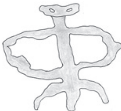
Figura N° 5.

Este antropomorfo con la cabeza despejada; pero quizá esta circunstancia sirva para mostrarnos con mayor claridad todo lo expuesto anteriormente. (En cuanto a los diferentes símbolos que conforman el ideograma en su conjunto ya los hemos tratado también con anterioridad).