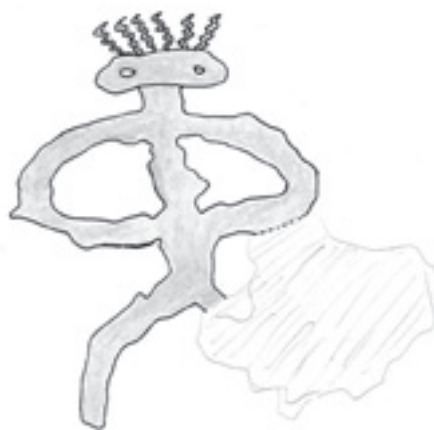
Figura N° 6.

Este antropomorfo con la cabeza despejada; pero quizá esta circunstancia sirva para mostrarnos con mayor claridad todo lo expuesto anteriormente. (En cuanto a los diferentes símbolos que conforman el ideograma en su conjunto ya los hemos tratado también con anterioridad).