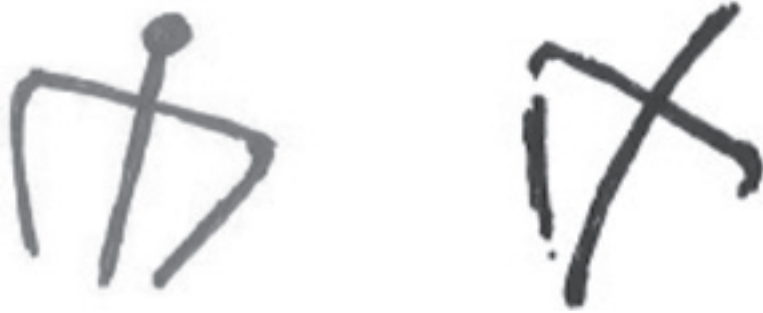
Figura N° 10.

Esta figura procedente de la Cueva del Cudón (Cudón- Miengo, en Cantabria), es del mismo estilo que la de Navalcán. Es curioso cómo a pesar de la gran distancia entre uno y otro yacimiento se suceden estas correspondencias.