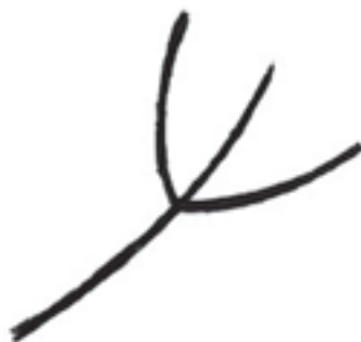
Figura N° 9.

Procede del Abrigo de Olearso en Guipúzcoa, se trata de un grabado en la roca.