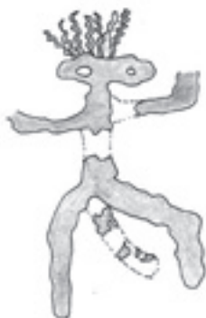
Figura N° 2.

La interpretación correcta es que se trata de dos pechos femeninos rodeados de serpentiformes en un acto claro de fecundación; la ausencia de escenas fálicas indica que la procreación tenía una consideración ajena a la relación sexual.