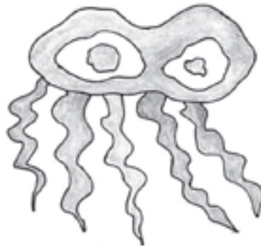
Figura N° 1.

Para mantener la tesis de que estamos ante un sistema de escritura contamos con la repetición de símbolos que se intercalan, formando una sucesión comunicativa al igual que ocurre hoy con los sistemas de escritura actuales.