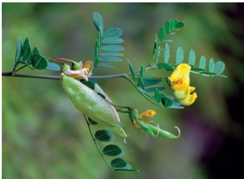
Colutea hispánica, arbusto endémico del centro y sur ibéricos, es escaso y donde aparece es especie indicadora de hábitats de calidad