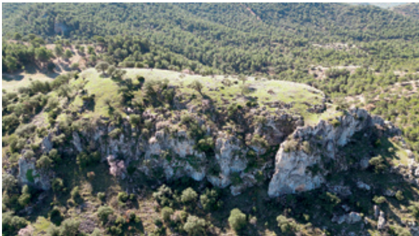
Panorámica desde el Norte del castillo de la Piedra del Águila (Cambil-Mata Begid).