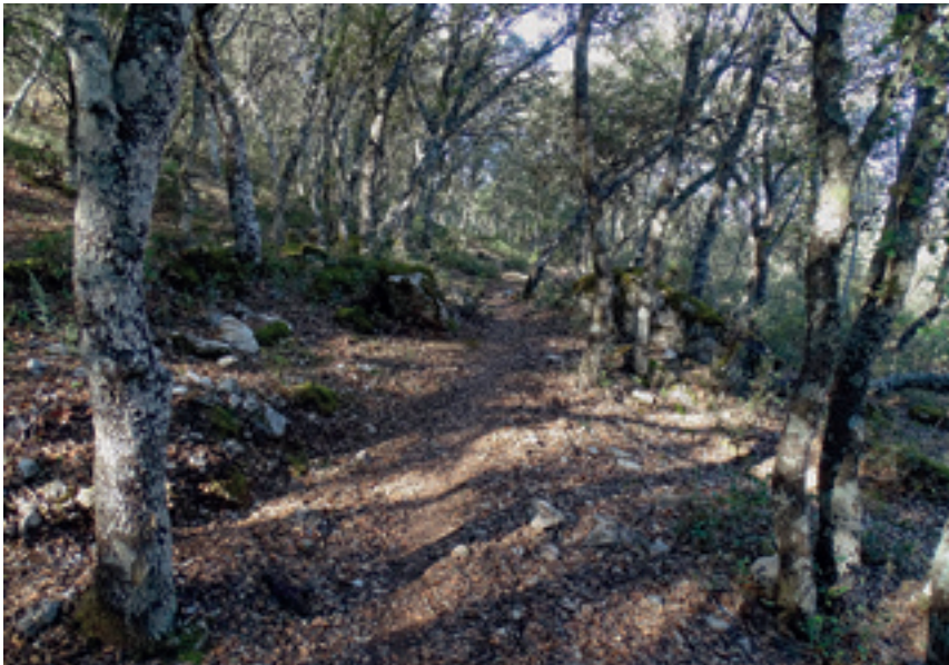
Umbría de los Corzos, tramo del camino del Centro de Visitantes a la Piedra del Águila

unos metros, encontrar una amplia vereda que seguiremos a la derecha y que muy pronto nos introducirá en la conocida como Umbría de los Corzos . Esta zona cuenta con un bosque mediterráneo muy bien conservado en el que podemos disfrutar de buenos ejemplares de encinas, quejigos y pinos carrascos. También existe en este bosque un arbusto ( Colutea hispánica ), relativamente escaso, llamado vulgarmente “Espantalobos”, es la planta nutricia de una especie de mariposa diurna ( Iolana debilitata ), muy rara y localizada en sierra Mágina, cuyas orugas se alimentan de sus semillas. Unos juncos junto a la vereda nos delatan la existencia de una fuente natural que, a pesar de su escaso caudal, nunca ha dejado de manar agua y es visitada por diversas especies de animales entre los que abundan los insectos como abejas, avispas, mariposas... Poco después del manantial nos encontramos que la vereda pasa por un lugar despejado cuyo suelo se preparó para hacer los famosos boliches para obtener carbón. La vereda llega a un amplio carril que, en apenas un km, nos deja en la base de la conocida como la Piedra del Águila y a cuya cumbre subimos por su ladera Este, única por la que se puede acceder a esta cima de manera cómoda.