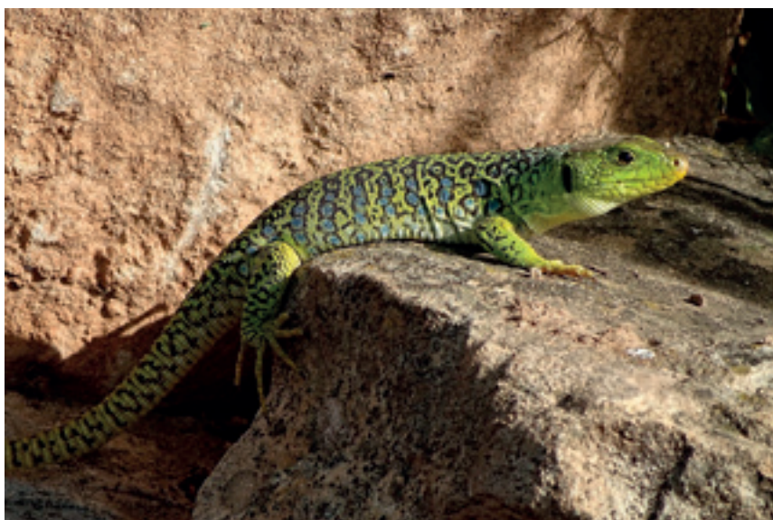
Lagarto ocelado ( Timon lepidus ) soleándose sobre una piedra