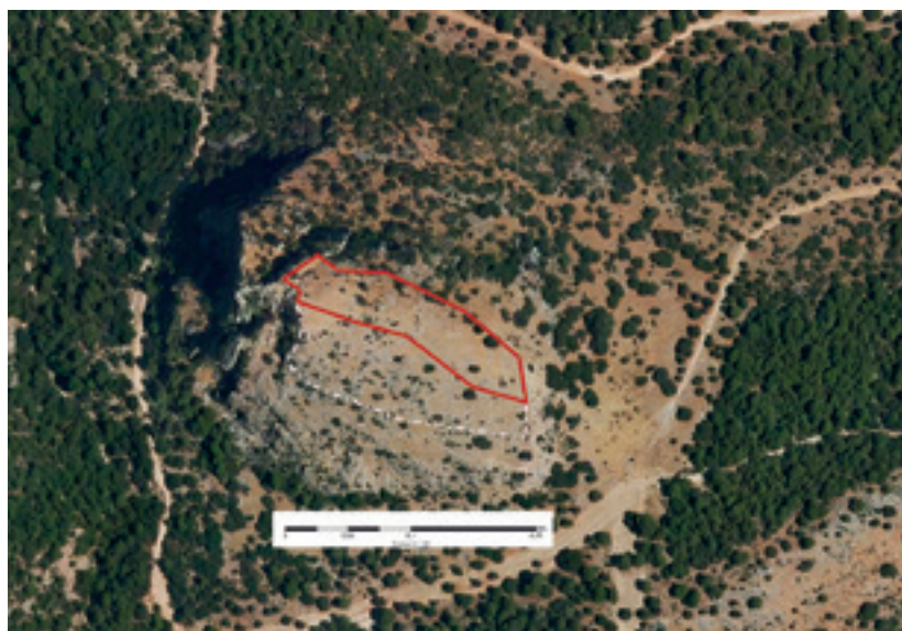
Ubicación del castillo de la Piedra del Águila (Cambil-Mata Begid). Ortofoto, IGN.