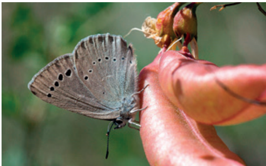
Mariposa del espantalobos ( Iolana debilitata ) muy escasa y localizada en Sierra Mágina