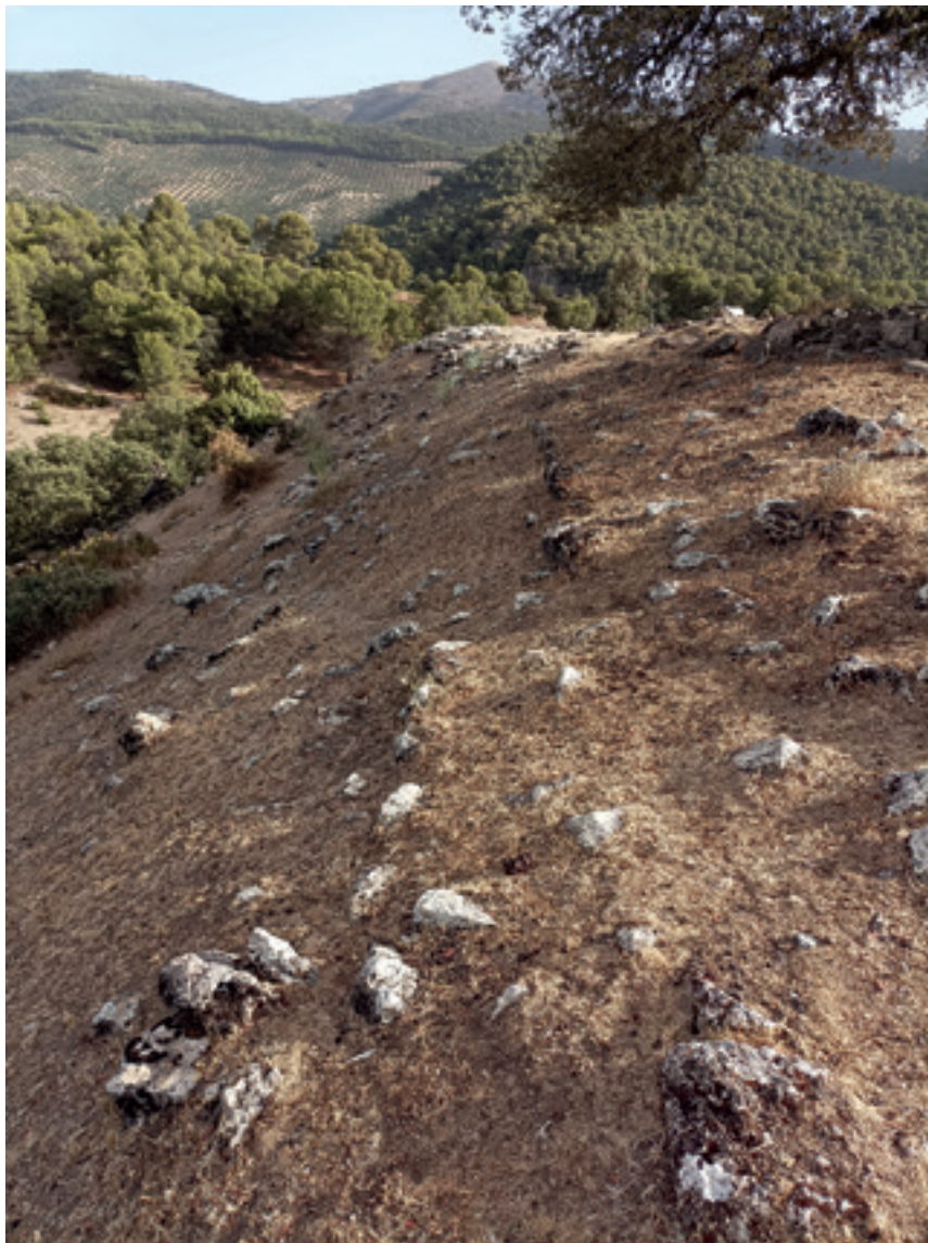
Restos de muralla. Zona Oeste del castillo de la Piedra del Águila (Cambil-Mata Begid)

Fotografía: (octubre-2022 / marzo-2023):