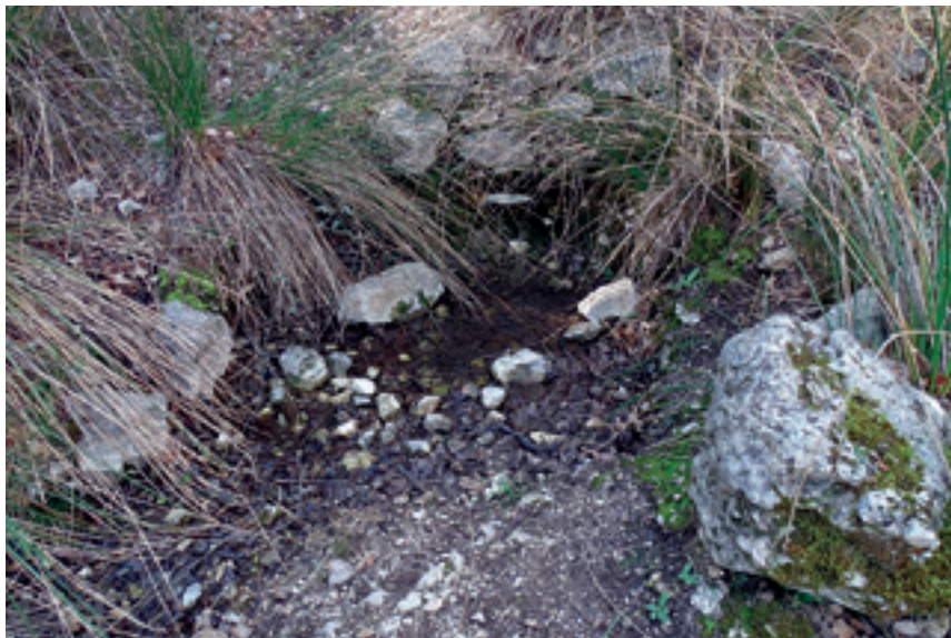
Surgencia natural de agua junto al sendero en la Umbría de los Corzos