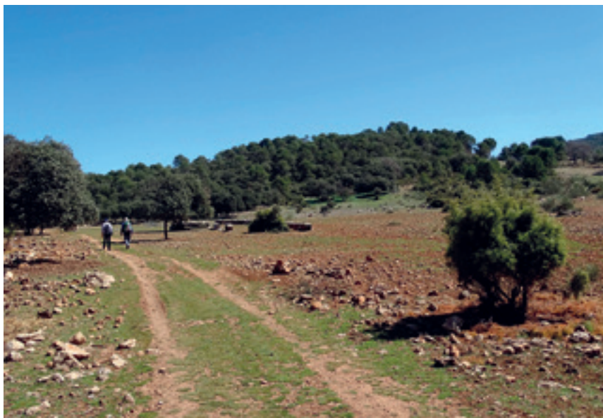
Tramo de la Piedra del Águila al Centro de Visitantes de Mata-Begid, junto al colmenar.