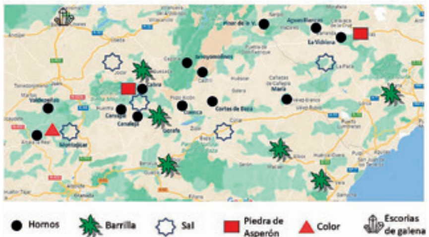
Figura 2.- Mapa de las materias primas.

Pero de todos, hay un centro productor representativo que reunía en sus inmediaciones, además de la leña, la sal necesaria para la fabricación de sosa, la barrilla, la arena y las piedras para la construcción de los hornos y crisoles. Se trata de Cabra del Santo Cristo. Más concretamente el horno del Chantre, un lugar donde abundaba la leña y en cuya cara oeste la toponimia rememora la actividad vidriera en el barranco “del Arenero”, lugar muy cercano a la salina que estuvo en explotación hasta la segunda mitad del pasado siglo y que ya aparecía en el Catastro de Ensenada. No muy lejos, las canteras de asperón producían las piedras para los hornos, no sólo de Cabra, pues su presencia en la obra de la iglesia de Castril puede indicar su comercialización hacia otras localidades. Si además tenemos en cuenta el privilegio otorgado a Diego de Espinosa en 1499 para abastecerse de la barrilla que se producía entre los términos de Úbeda y Guadix 13 , o que según el diccionario de Pascual Madoz se criaba esta planta en la cercana localidad de Alamedilla, constatamos la existencia de esta materia prima en los alrededores de Cabra. Con el color obtenido en la cercana Montejicar tenemos todas las materias primas necesarias para