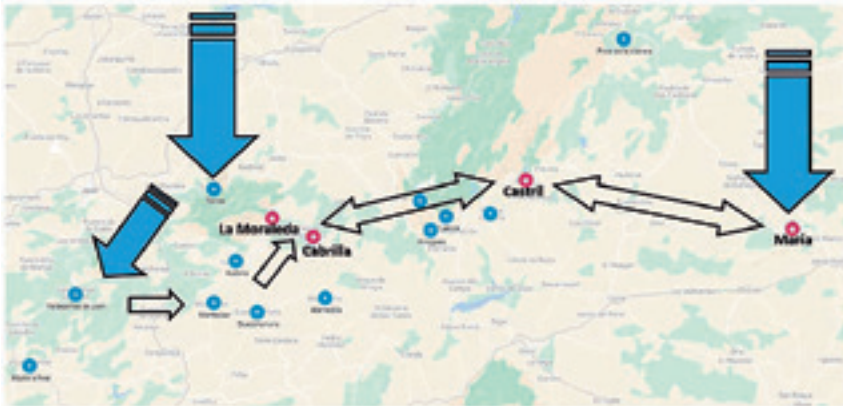
Figura 4.- Localización de centros productores y flujos comerciales.

Apagados los hornos de poniente de Sierra Mágina entre mediados del s. XVII y del XIX el vidrio de María, Castril, Cabra y La Moraleda pudo alimentar sin competencia alguna de “vidrio ordinario” todo el sur peninsular, pues Cadalso miraba al centro y la Granja se dedicó al cristal. El final vino dado por los cambios tecnológicos y el nuevo modelo industrial que significó la fábrica de Santa Lucía de Cartagena, establecida en 1834 precisamente por descendientes de genoveses establecidos en la zona en siglos anteriores gracias al comercio de la barrilla.