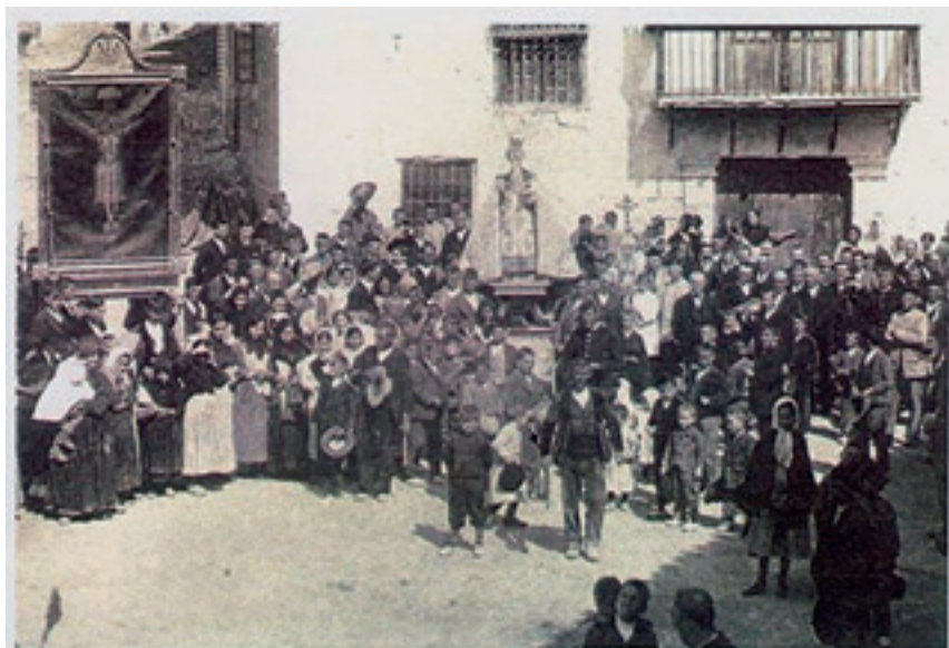
Figura 3.- Castril de la Peña; una procesión a principios de siglo XX donde se ve un lienzo con la iconografía del Cristo de Cabrilla.

Por tanto, la actividad del transporte y comercialización de la producción ocupó a buena parte de la población, resultando llamativo el número de arrieros dedicados a ello. En el caso de Cabra, el catastro de Floridablanca si detalla nombre, apellidos y edad de cada uno de los cuarenta arrieros que había por entonces declarados -muchos de estos apellidos coinciden con los de los vidrieros-. Los mismos que arroja el catastro de Ensenada en Jódar y una cantidad muy parecida a los que había en María. Pero es que en Castril había cincuenta y en Bélmez otros seis. Tanto, que fundaron una cofradía gremial que ha perdurado hasta pasada la segunda mitad del siglo pasado, aunque lamentablemente no existe información sobre su fundación en el archivo parroquial de Cabra, lo que podría sig-