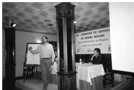
Desarrollo de las Jornadas