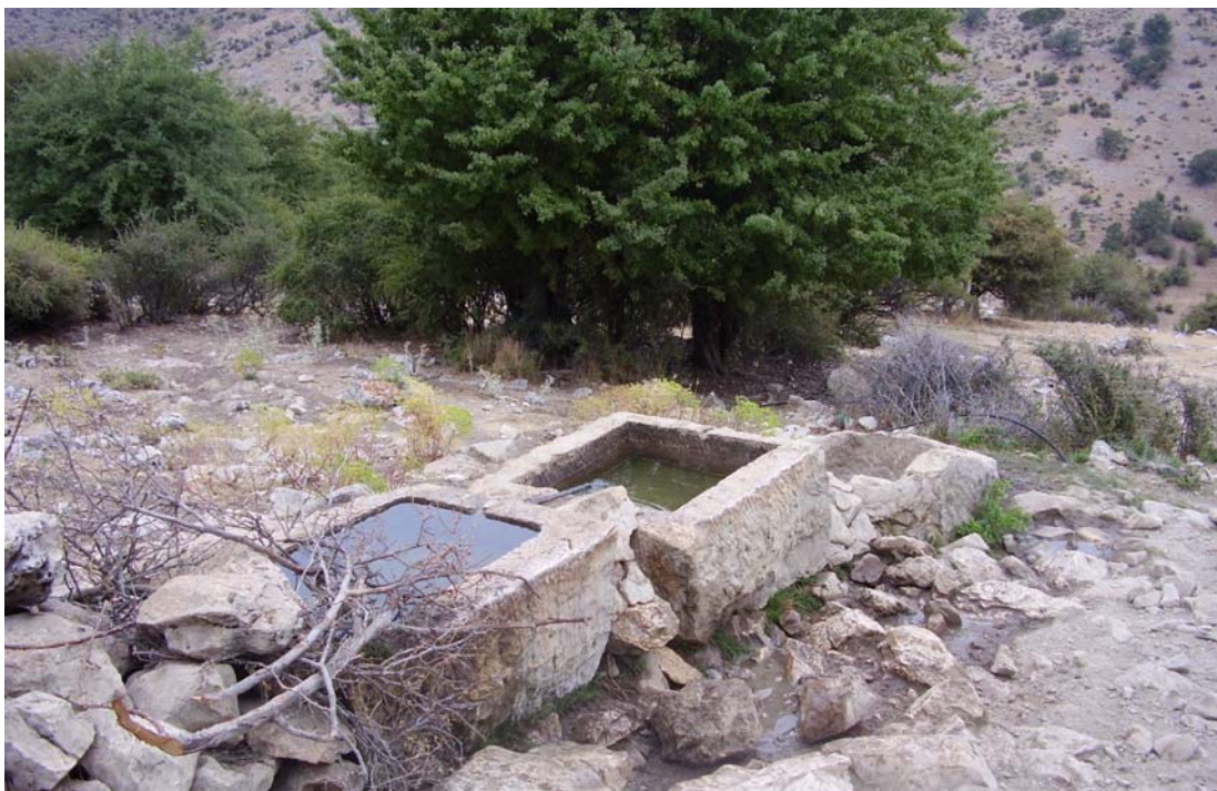
Foto 1. Vista del corralillo.