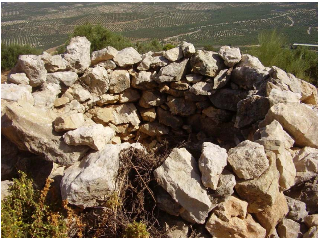
Vista parcial del puesto de caza construido sobre el caracol