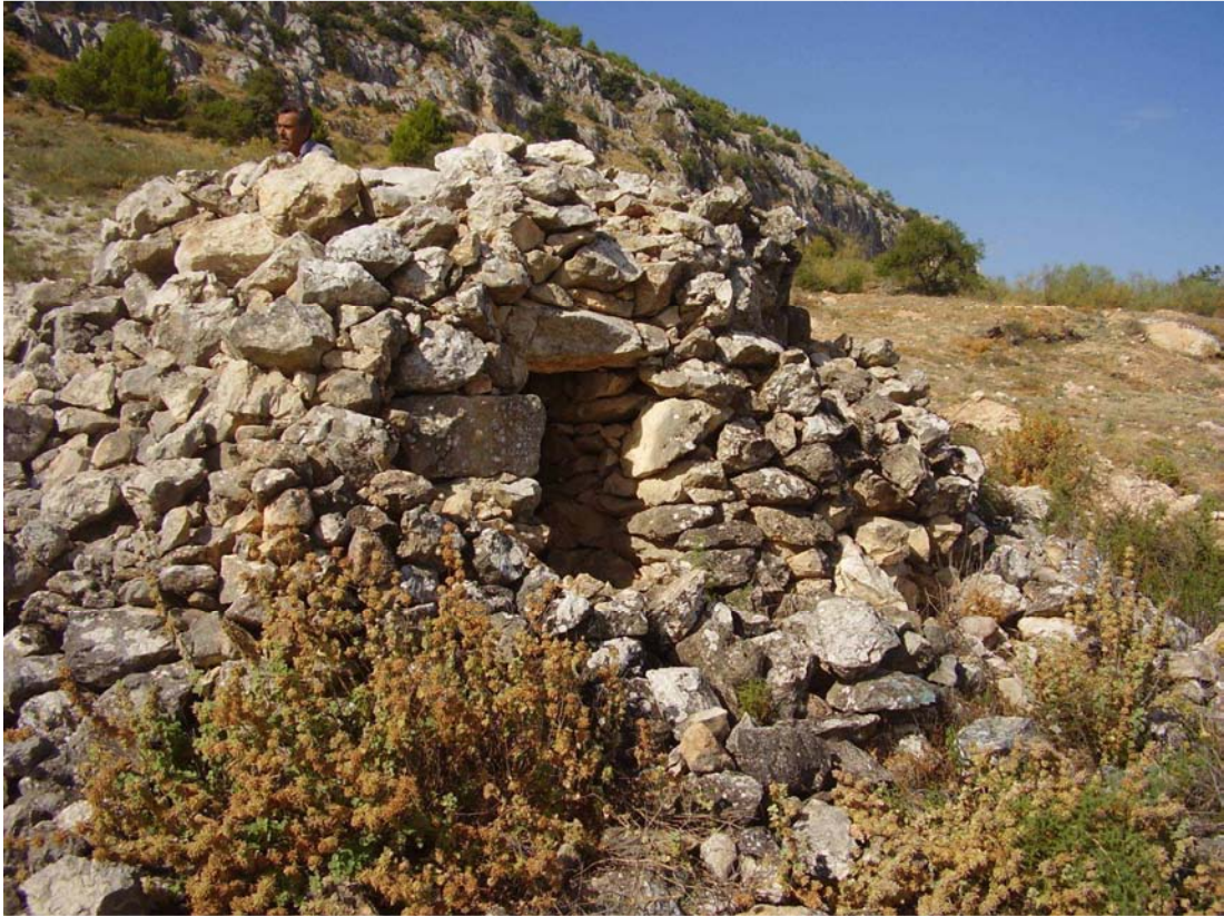
Vista del Chozo del Hoyo del Portillo-2