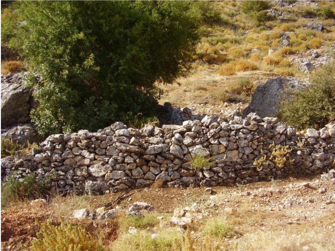
Vistas del corral del Hoyo del Portillo