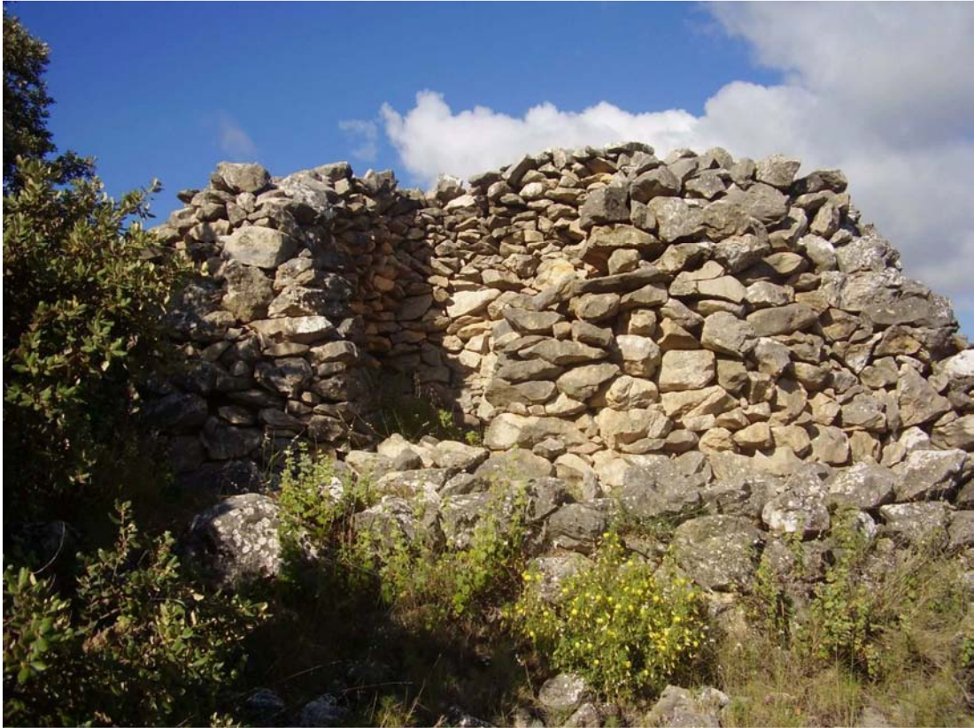
Vista frontal del rancho de la Cañada del Ranchuelo