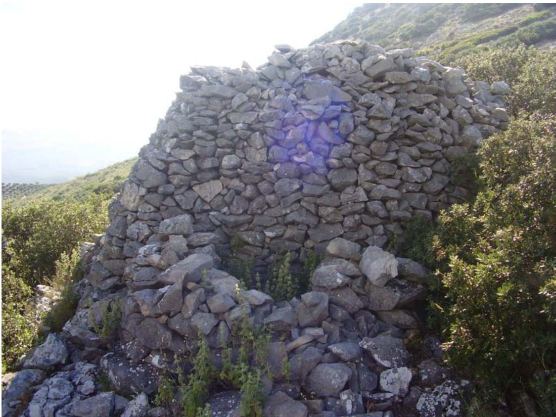
Vista por detrás del rancho de la Cañada del Ranchuelo